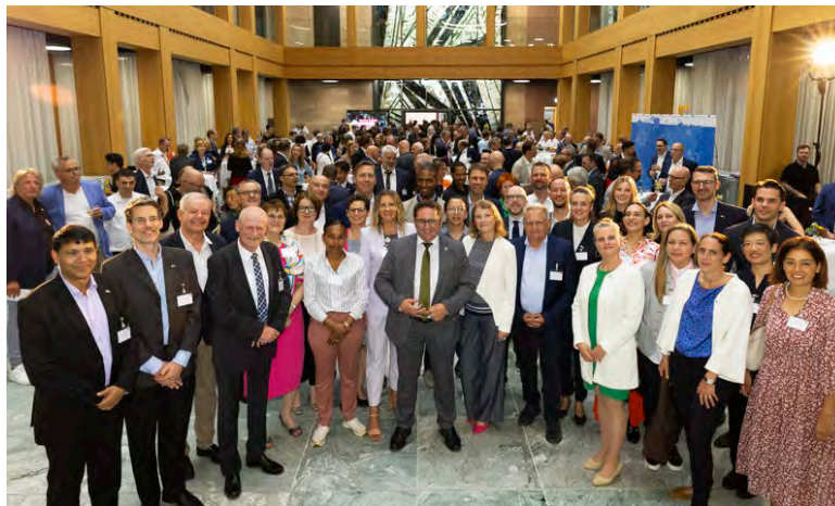
Representantes Bávaros junto al Secretario de Estado Tobias Gotthardt. @StMWi

Más Información aquí https://shorturl.at/HazSH