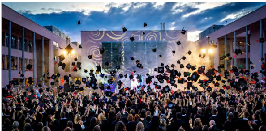
Alumnos del Centro de Formación THD, celebrando su nuevo título académico.

Más Información aquí www.th-deg.de/weiterbildung